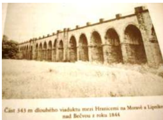
Část 543 m dlouhého viaduktu mezi Hranicemi na Moravě a Lipkem nad Bečvou z roku 1844

Aby bylo jasno. Když někoho označíme za nevzdělance, ještě tím nechceme dát najevo, že nezná trojčlenku, či že neumí řešit rovnice o dvou neznámých, a nedej bože také integrály. Rovněž tím ani nezpochybňujeme jeho znalosti anglického jazyka. Nevzdělanost může být také neschopnost člověka použít jistých znalostí v kontextu s ději minulými, přítomnými a budoucími. A to proto, aby mohl rozhodnout efektivně, poctivě a především odpovědně. Ještě větším projevem neschopnosti je ovšem to, že člověk uvedené znalosti nemá, čímž vůbec nemůže rozhodnout jakkoli. Ve všech případech pochopitelně špatně.